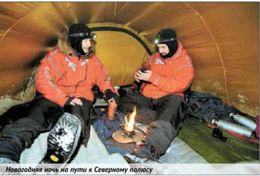
Новогодняя ночь на пути к Северному полюсу

Все нормально, но трудный день. Температура: «-18», ветер 10–12 м/с. Много разведываю. Как правило, находили мошки. Один раз надели костюмы. Сильный северный ветер. Шли на се-