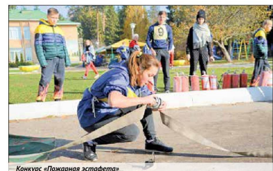
Конкурс «Пожарная эстафета»

сделать площадку. Участники преодолели восемь конкурсов: «Спортивная универсиада», «Визитная карточка ДЮП», «Смелый строя и песни», «Пожарная эстафета», «Пожарная круговая», «Соревнования по программе СТГ», «Конкурс стенгазет» и «Конкурс агитбригад».