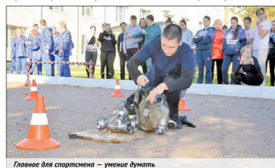
Главное для спортсмена — умение думать