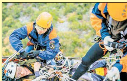
Самым трудным этапом была транспортировка пострадавшего по сложному горному рельефу с помощью специальных средств