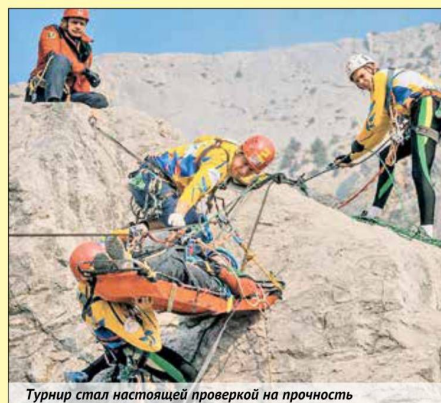
Турнир стал настоящей проверкой на прочность

Из инстаграм-профиля Российского союза спасателей @ruor_org мы отобрали фотографии, которые расскажут о самых ярких моментах турнира.