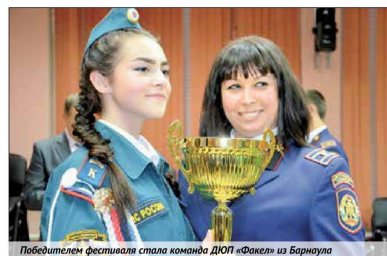
Победителем фестиваля стала команда ДЮП «Факел» из Барнаула

Как показывает опыт организаторов всероссийского смотр-конкурса, в финале победителем