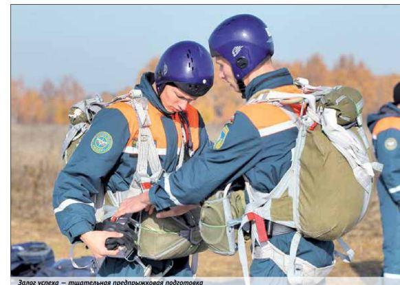
Залог успеха — тщательная предпрыжковая подготовка