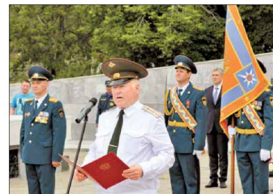
Герольмейстер МЧС России на вручении Боевого знамени

Праздники на самом высоком уровне — А как проходит регистрация знаков?