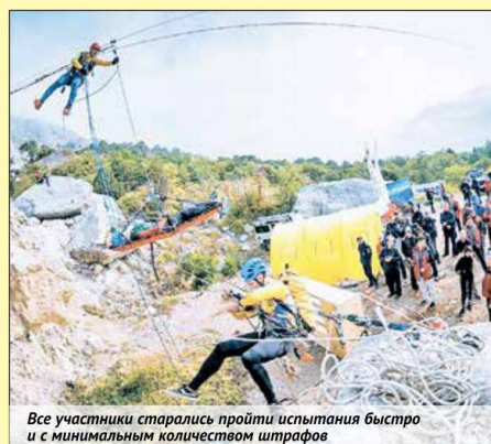
Все участники старались пройти испытания быстро и с минимальным количеством штрафов