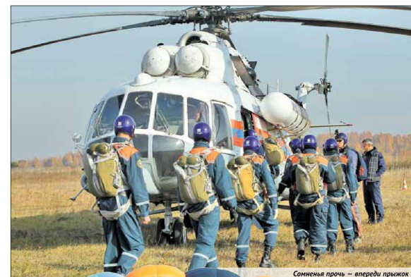
Сомнения прочь — впереди прыжок