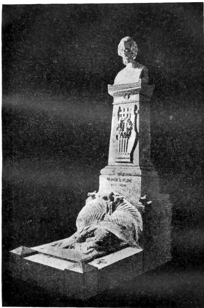
Памятник Г. Гейне на кладбище Монмартр в Париже Работа скульптора Госсельерис 1904 г.